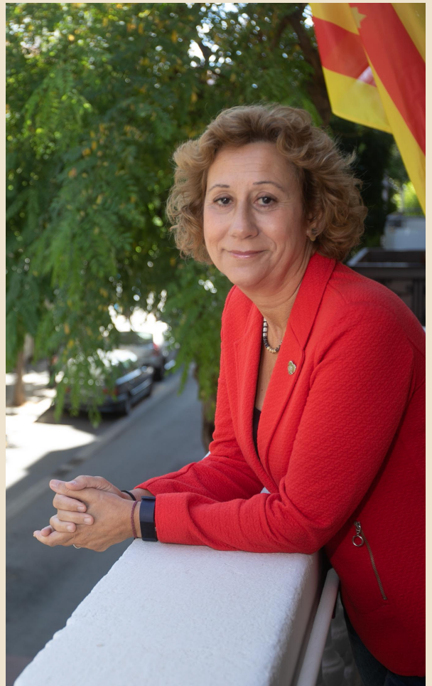
Belén García Criado Alcaldessa de Sant Joan Despí

L'Ajuntament de Sant Joan Despí i l'Àrea Metropolitana de Barcelona posen de nou en marxa la campanya destinada a ajudar a la rehabilitació dels edificis i els habitatges de la nostra ciutat. En aquesta ocasió, amb dues grans línies de subvencions: una destinada a aconseguir una millor eficiència energètica i una segona que té per objectiu ajudar a l'accessibilitat i la mobilitat interior dels habitatges. Les relatives a l'energia compten amb el suport dels fons Next Generation de la Unió Europea, en el context del Pla de Recuperació, Transformació i Resiliència per tal de lluitar contra el canvi climàtic i promoure l'estalvi energètic. En aquest díptic trobareu les línies bàsiques de les ajudes, que espero aprofiteu per tal de millorar casa vostra i també la nostra ciutat.